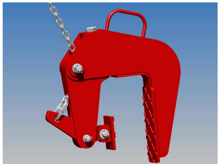
Betoncső fogó megfogó szerkezete